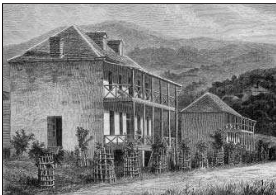
Dessin de E. Dardoize d'après une photographie de M. E. de Greslan

Une maison dont la présence peut rappeler l'histoire parfois chaotique de Canala mais qui doit aussi sa survie grâce à l'union d'un Européen et d'une Kanak... Tout un symbole !