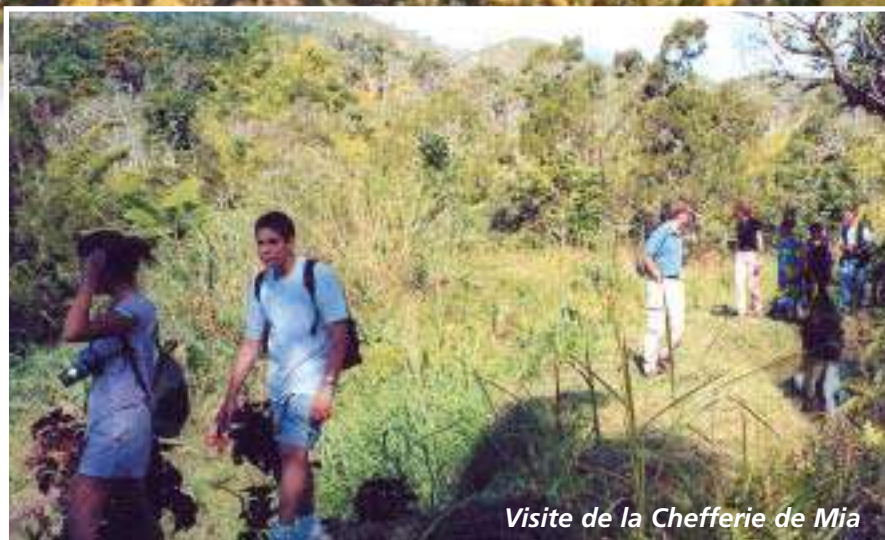
Visite de la Chefferie de Mia

Sur terre, nos guides locaux les ont promenés à Mia, Kaco ou Boakaine et les ont enchantés