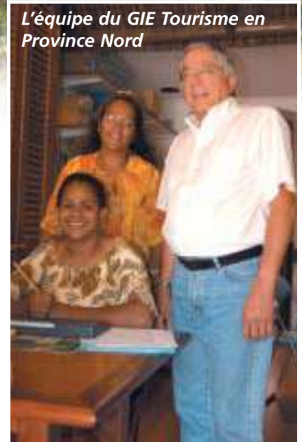
L'équipe du GIE Tourisme en Province Nord

Un élan partagé par toutes les associations qui ont hébergé, restauré, animé ou proposé vannerie, plantes, sculptures ou coquillages aux centaines de