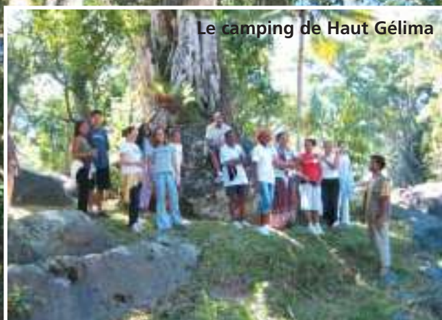
Le camping de Haut Gélima

Nous avons fait nos preuves. A nous de ne pas décevoir tous ceux qui souhaitent revenir chez nous. L'élan a été donné grâce à la collaboration appréciée des trois partenaires, nous sommes tous capables ici de poursuivre cette dynamique. Nous avons encore tellement de choses à donner et tant de lieux à faire découvrir... et nous savons si bien le faire.