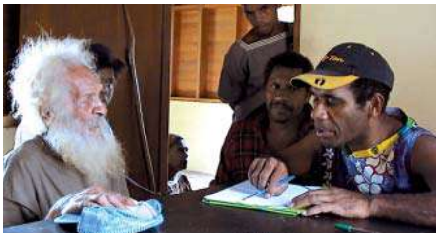
Nos anciens sont détenteurs d'un savoir que nous ne devons pas laisser disparaître. Il est temps de passer de la tradition orale à l'écrit...

Des écrits qui ne seront d'ailleurs pas rendus publics