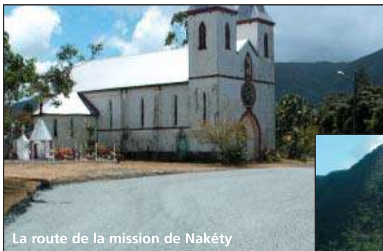
La route de la mission de Nakéty

Poursuite des travaux de voirie : assainissement et goudronnage