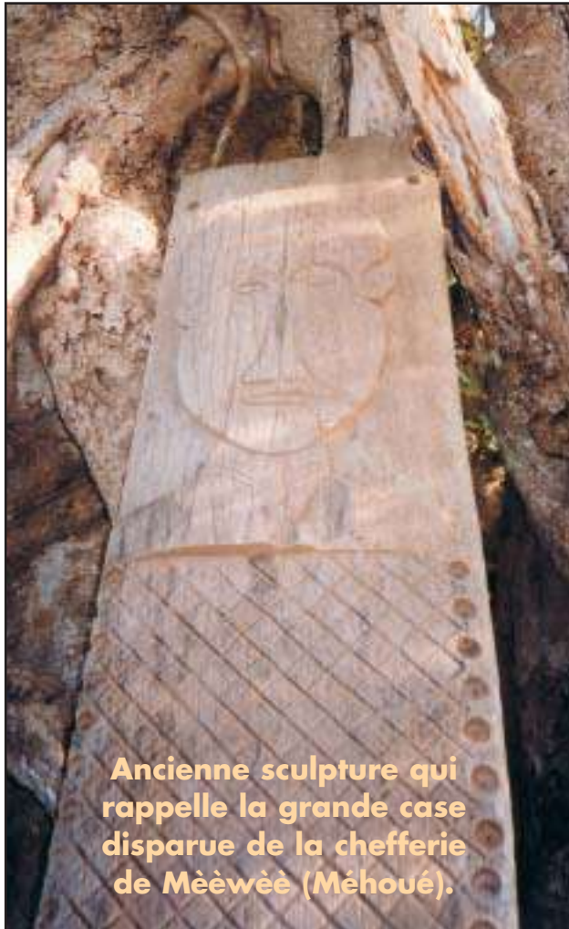
Ancienne sculpture qui rappelle la grande case disparue de la chefferie de Mèèwèè (Méhoué).

Il reste maintenant à concrétiser en gravant les noms sur des panneaux. C'est aux jeunes sculpteurs qu'incombe la tâche de production et de réalisation.