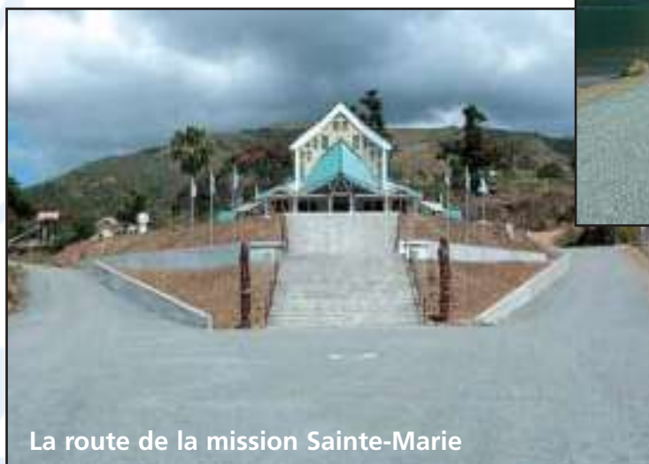
La route de la mission Sainte-Marie