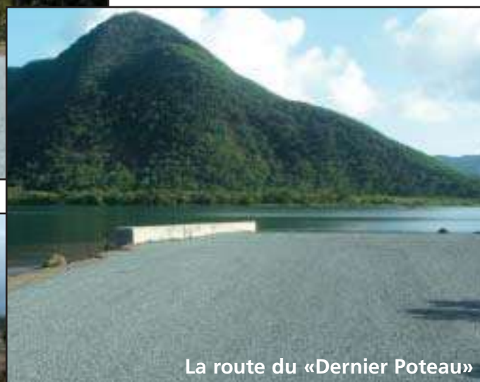
La route du «Dernier Poteau»

Poursuite des travaux de voirie : assainissement et goudronnage