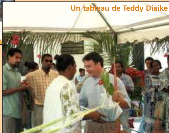
Un tableau de Teddy Diaike

« Ces cadeaux ne sont pas offerts parce que tu pars, mais pour que tu reviennes », le personnel municipal.