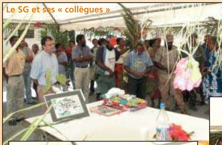
La flèche faitière de Canala