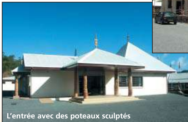
L'entrée avec des poteaux sculptés

L'ancienne mairie construite par M. Emile Néchéro, aujourd'hui reconvertie en salle socio-culturelle