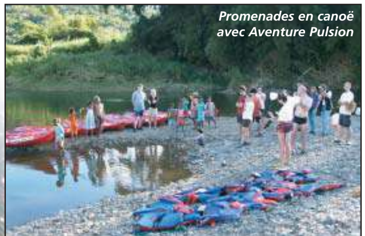
Promenades en canoë avec Aventure Pulsion

Réactions unanimes aussi de la part des visiteurs. En répondant à l'enquête proposée par le GIE, ils ont mis en avant l'organisation sans faille de cette manifestation, la grande gentillesse des habitants de Canala, leur accueil chaleureux, la diversité des anima-