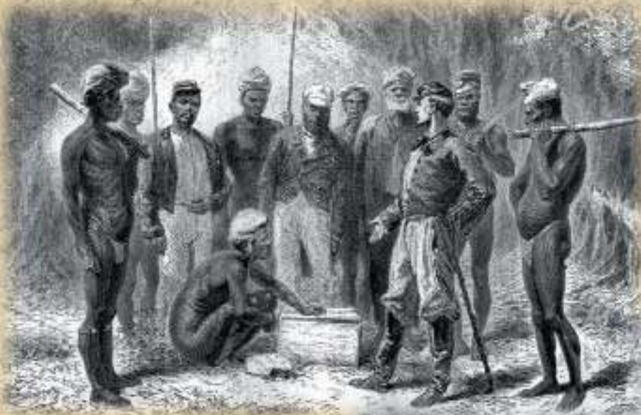
Un envoyé français distribuant des présents à des chefs indigènes. Dessin de A. de Neuville d'après une photographie.