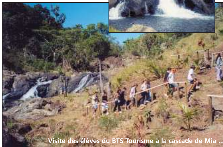
Visite des élèves du BTS Tourisme à la cascade de Mia ...