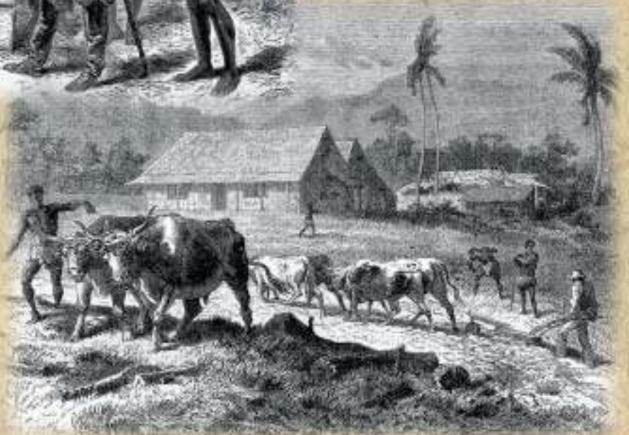
Maison d'habitation de M. Pion, planteur à Kanala, Dessin de Emile Bayard d'après une photographie de M. E. de Greslan.

Cette dépossession a conduit à une perte des repères identitaires. L'organisation sociale kanak, même si elle a été reconnue dans ses principes, s'en est trouvée bouleversée. Les mouvements de population l'ont déstructurée, la